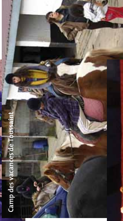
Camp des vacances de Toussaint