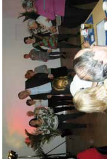
Succès renouvelé pour le dîner de Noël des Seniors qui a eu lieu le 21 décembre 2010.

Het Kerstdiner voor Senioren dat plaats had op 21 december 2010 was weerom een waar succes.