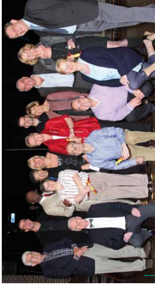
Célébration des Mérites Sportifs 2010. Viering van de verdiensteijkke sportlui 2010.