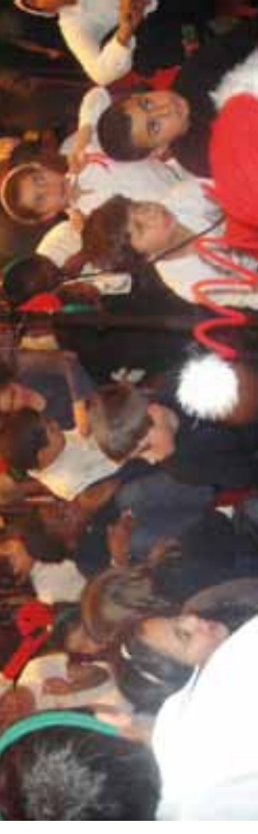
En 2010, les écoles de devoirs ont organisé une multitude d'activités pour nos jeunes. In 2010 organiseerde de takscholen tal van activiteiten voor onze jongeren.