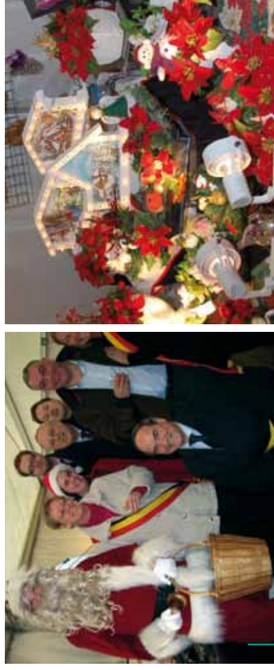
Chaleur et convivialité au marché de Noël les 11 et 12 décembre 2010. Warme gezelligheid tijdens de Kerstmarkt op 11 en 12 december 2010.