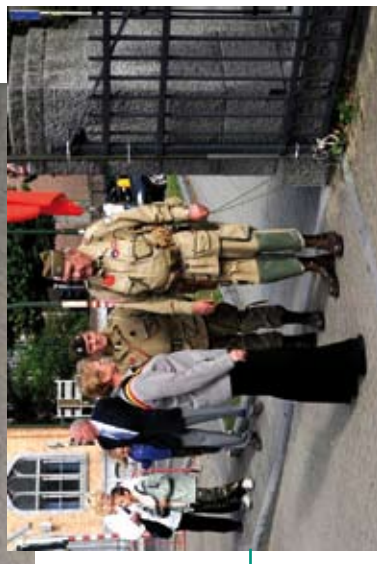
Ter gelegenheid van de 65de verjaardag van de bevrijding van Brussel, werd tijdens de Jaarmarkt een militair kamp opgericht op het Basiliekvoorplein !