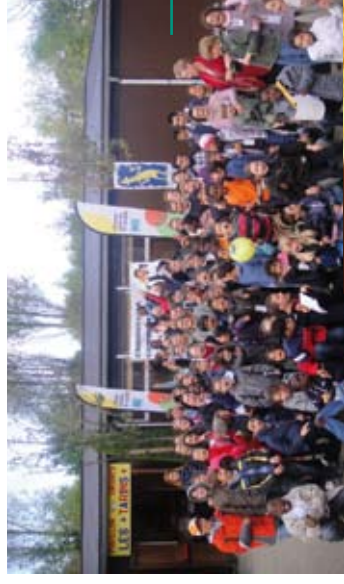
La journée « Place aux Enfants » a rencontré un franc succès !