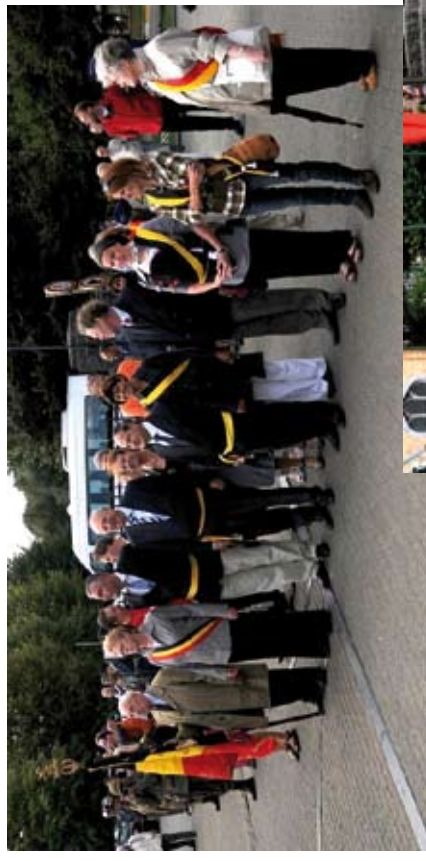
A l'occasion du 65 e anniversaire de la libération de Bruxelles, le marché annuel accueillait une reconstitution d'un camp militai- re aux alentours de la Basilique !!