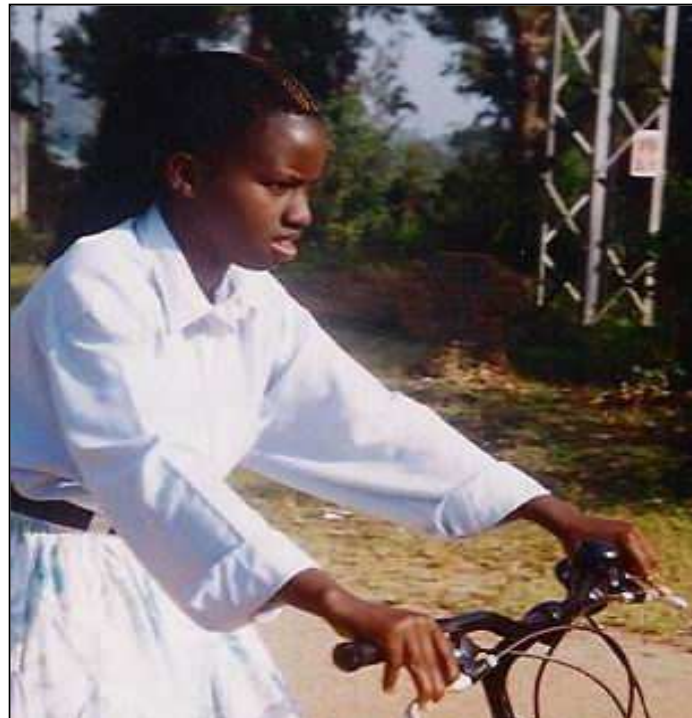
Een «gezondheidshelpster» gesteund door de Jumelage, trekt per fiets door de heuvels voor de toelichting van de vaccinaties- en hygiënecampagnes, de aids-preventie enz.

De steun aan de fundamentele mensenrechten, gezondheidszorg en onderwijs, loopt o.a. via de hulp aan de gezondheidshelpsters en de bevoorrading van medicamenten. Hiertoe werd in 1972 gestart met de bouw van het gezondheidscentrum, met de steun van 11.11.11. Het centrum werd uitgebreid (1993) en onlangs uitgerust met een aparte aids-afdeling (verzorging en kraamkliniek). Een sociale actie om de minst bedeelden aan te moedigen tot zelfstandigheid, geïnspireerd door de zelfhulpmethode van ATD – 4 de Wereld, startte eind 2004.