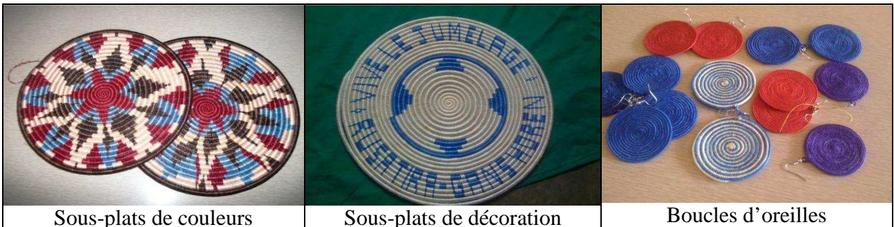
Sous-plats de couleurs

Les coûts couvrent ici la formation, les kits de démarrage et le lancement de la commercialisation. Ci-dessous quelques objets fabriqués par REPRECO à Rusatira.