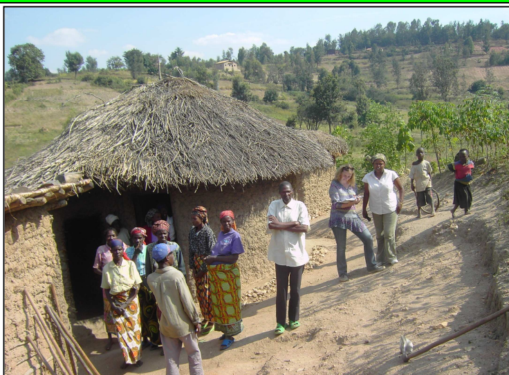
Visite de ménages vulnérables en préparation du projet REPRECO (2011)

Le projet REPRECO ( RE gression de la Pré carité par le RE nforcement des CO opératives) a démarré ses activités en mai 2012. Il intervient dans les domaines de l'agriculture et élevage ainsi que dans le domaine psycho-social pour améliorer les conditions de vie des ménages vulnérables [qui sont les «bénéficiaires» du projet, constitués en coopératives consacrées à des AGR Activités Génératrices de Revenus].